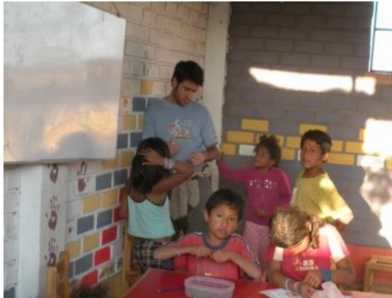
Haciendo sus tareas

Los medianos realizando sus tareas y su taller de manualidades. Aquí esta el grupo más numeroso. Cada día se puede ver mejoras en ellos, aunque sea lentamente pero van mejorando poco a poco. Son niños muy inquietos pero muy buenos e inteligentes.