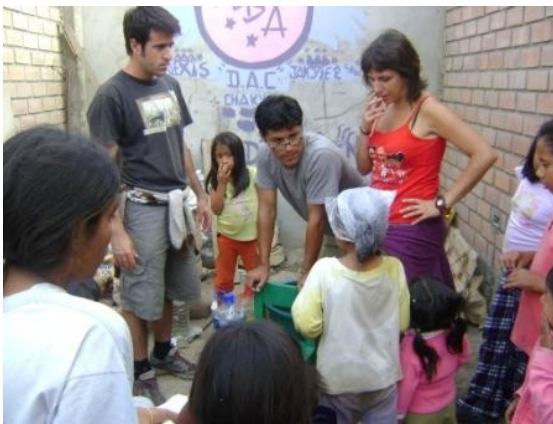
Lavando las cabezas

La semana pasada hemos continuado con el lavado de cabeza de los niños. Como sabrán esto lo hacemos de cada 15 a 20 días. Muchos de los niños no cuentan con agua en sus hogares, y eso hace que sea difícil su limpieza diaria.